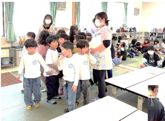
時間差で1年生からスタート！

○×クイズに答え、正解だと思う番号へ進み、次々問題を解いていくとゴール！ というイベントの第2弾！！去年の11月に第1回クイズラリーを開催しています！ 初めての挑戦となる1年生には難しい問題もあったと思いますが、最後まで根気強くよく頑張りました！